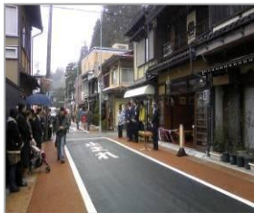
観光客のよく通る道筋。道もきれいに整備されて、歩道も明るくなった