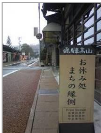
出口の右は八幡神社