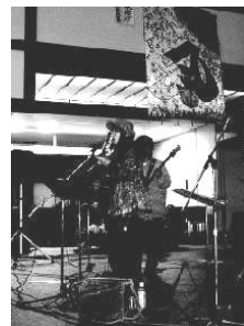
エンディングは さいばいずのライブ♪

12月1日と2日、いつもは用事で行くだけの市役所が にぎやかなこどもの城に変身！地下から4階、屋外まで使 っての大イベント「冬のあったか縁日」が催されました。