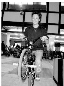
▲初参加BMXチーム 市役所の空間を 自転車が舞う！！▶