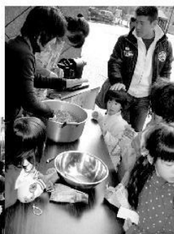
▲屋外に長蛇の行列！ ボン菓子のぼん太 今回は「食」の企画もいろいろでした