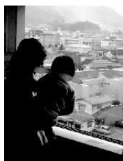
あったかお天気の2日間でした 突然の降ったひょうにはびっくり！