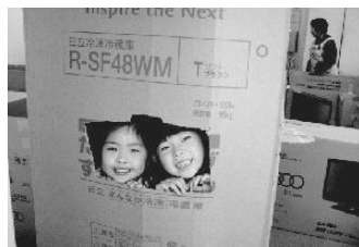
つくる日とあそぶ日どっちも楽しめたかな？ 縁日といえば・ダンボール迷路!!