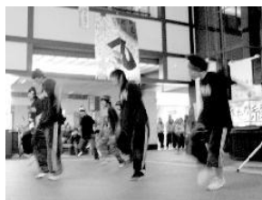
高校生&社会人の男子ダンスチームが堂々登場 ▼市役所のウインドウでいつも練習している若者たち