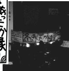
1階ロビーを飾った 行灯風な演出・・・