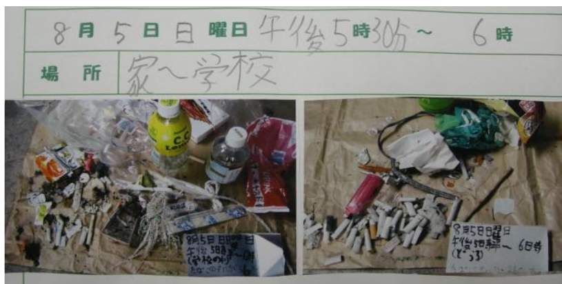
どうろには、タバコのすいがらが46本も落ちていました(写真右) 学校の中には、おかしのごみがたくさんおちていました(写真左)