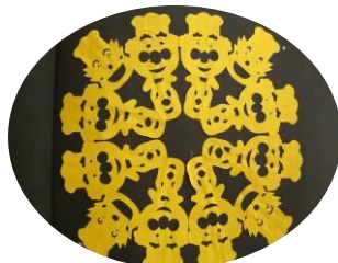
かんかこかんて実物を見てみてね

他、おなじみとなったグラスアート、ミニ本、さるぼぼと、どの講座も楽しい時間となりました。