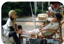
足裏リフレクソロジーの ユワタイクワッタイコーナー

朝7時から昼1時まで。平日開催の八日市は朝市の感覚だ。国分寺の境内ということでひろばの人の流れはゆったりとしている。ビーチパラソルに籐のイス、会話を交わしながら足裏マッサージを受けられる癒しのひと時。ユッタイクワッタイ(沖縄の古語でゆっくりして行ってくださいの意味)という言葉のひびきも青空の下でマッチしている。