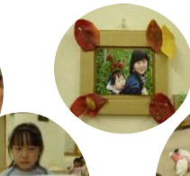
ノンプログラムで、遊んだり、本を読んだり、工作と自由に遊べるこどもひろば。りんご狩り企画などの催しも人気です。