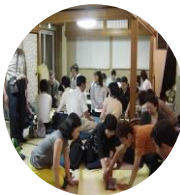
人気の金曜野菜市。遊びに来るおかあさんや観光客。地域の常連さんもおまちかね→

“あったかいこころの居場所づくりをすすめたい人たちのつながる集い”が、18日午前10時よりかんかこかんです。情報を持ち寄って、意見交換をしながら、それぞれの地域にあった思いを形にしてみませんか。