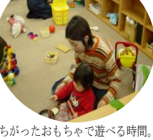
家ともちがったおもちゃで遊べる時間。