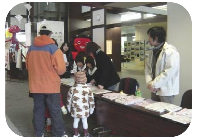
▲ふだん薄暗い市役所ロビーが照明ですっきり明るいイメージに。地下ホール、ロビー、2階、3階とアミューズメントホールのようなでした。

それぞれの活動が、このご縁をきっかけに、年一回でなく日常の中でつながりあった活動に発展していくといいですね。